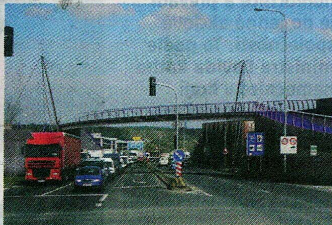
Vizualizace Praha 5

▲ Stavba lávky je v plném proudu, na pravém snímku je její budoucí podoba